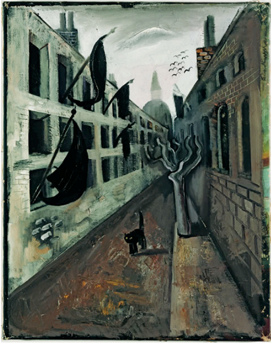
Felix Nussbaum Trostlose Straße, 1928 Öl auf Leinwand