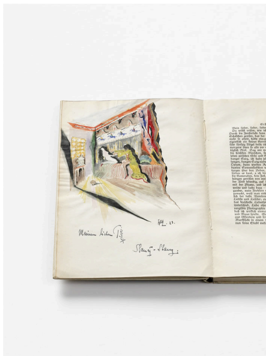
Malik Else Lasker-Schüler Der Malik, 1923