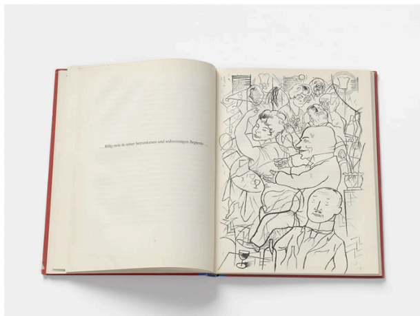
Richard Huelsenbeck, Doktor Billig am Ende. Ein Roman, 1921 Illustriert von George Grosz

In Palästina, das für Juden natürlich kein Exil ist, hat sie als alter Mensch „die Sprache dieses kühlen Landes“ nie erlernt – ein Schicksal, das sie mit vielen deutschsprachigen Exilanten im Ausland teilte.